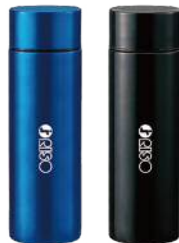
真空ステンレスボトル(140ml)