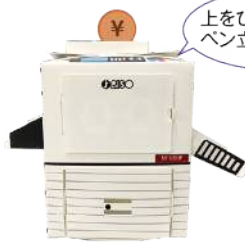
リソグラフ ペーパークラフト (貯金箱/ペン立て)

ご来場の記念に下記の中からお希望の品をおひとつプレゼントいたします。 下記の「 ご来場予約申込書 」に必要事項をご記入のうえ、FAXにてご返信ください。