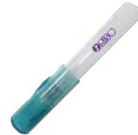
携帯型シミ取りペン

※1社様につき一点となります。※数に限りがあるため、ご希望に添えない場合がございます。また、記念品の内容が変わる場合がございます。